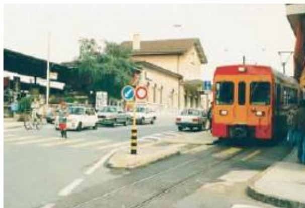
Jusqu'en 2003, le départ du train se trouvait face à la gare.

Lundi après-midi, à 14 heures précises, l'entreprise Perrin Frères SA donnait les premiers coups de marteau-piqueur d'un chantier visant à déterrer un tronçon désaffecté du Nyon-St-Cergue-Morez (NStCM). Un tronçon à l'abandon depuis onze ans qui longe la place de la Gare avant de passer sous le pont de la Morâche. Et qui témoigne d'une époque pas si lointaine: jusqu'au mois de juillet 2003, le départ du «P'tit train rouge» se situait en effet sur l'Avenue Edouard-Rod, à la hauteur de la station CFE. Un point de départ dont l'emplacement n'avait pas bougé depuis la création de la ligne en 1916. Près de cent ans plus tard, en juin 2004, la nouvelle station souterraine du NStCM avait fi-