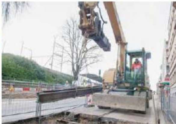
Lundi après-midi, les premiers rails d'acier ont été déterrés.

ans pour que l'Avenue Edouard-Rod soit «nettoyée» du tronçon désaffecté. Pourquoi avoir attendu si longtemps? «Au départ, nous voulions déterrer les voies im-